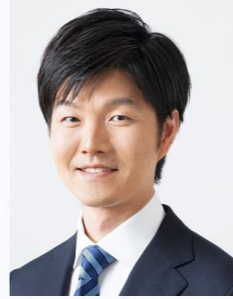
衆議院議員 鈴 木 憲 和

このたびの「授業力と学級経営力を高め、学級崩壊を食い止めるためのセミナー東北」の開催を、心よりお慶び申し上げます。