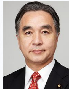
参議院議員 平 野 達 男

授業力&学級経営力を高め、学級崩壊を食い止めるためのセミナー東北のご盛會、まことにめでとございませす