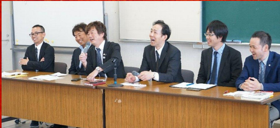
▲ 爆笑あり、うなずきありの大好評だった6県代表対談

人生の中で、先生の役割というのは非常に大きいと思います。近年、学級崩壊とかいじめとかの問題がありまして、議員としても子どもたちが健やかに育つというためにどのようなことが問題で、どのようなことをしなければいけないか、何が核心なのかということをつかむために参加いたしました。本日は本当にありがとうございます。