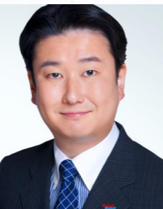
参議院議員 和 田 政 宗

「授業力&学級経営力を高め、学級崩壊を食い止めるためのセミナー東北」のご盛會をお慶び申し上げます。