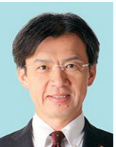
衆議院議員 秋 葉 賢 也

「授業力・学級経営力を高め、学級崩壊を食い止めるためのセミナー東北」の開催を心よりお慶び申し上げます。