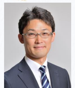
衆議院議員 藤 原 たかし

授業力と学級経営力を高め、学級崩壊を食い止めるためのセミナーが北上市において開催されますこと心よりお祝い申し上げます。