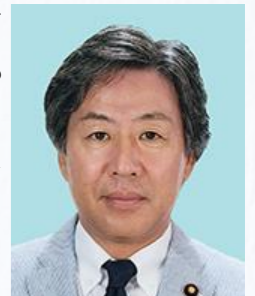
衆議院議員 安 住 淳

「授業力&学級経営力を高め、学級崩壊を食い止めるためのセミナー東北」が岩手県において盛大に開催されますことをお慶び申し上げます。