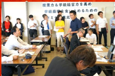
▲ 大好評の介入模擬授業講座