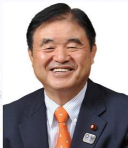
衆議院議員 遠 藤 利 明

本日は、「授業力&学級経営力を高め、学級崩壊を食い止めるためのセミナー東北」が開催されますことを、心よりお慶び申し上げます。