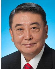
衆議院議長 大島 理 森

結びになりますが、本研修会の開催にご尽力されました関係各位の皆様方に、心より敬意を表します。