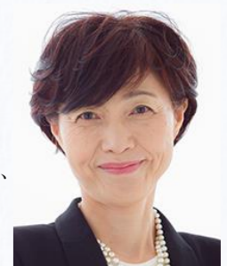
衆議院議員 高 橋 ひなこ

「授業力・学級経営力を高め、学級崩壊を食い止めるためのセミナー東北」の開催を、お祝い申し上げます。